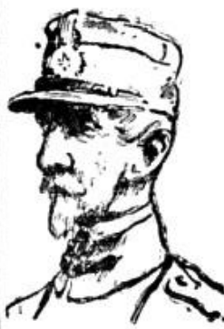
D. gen. Averescu va vorbi în ședința de azi a Senatului în legea regiei autonome C. F. R.

pur de mășline garantat cu analiză (vizit surărilor de fact) Se găsește permanent și se vinde en-gros și en-detali cu prețuri extrem de reduse LA MARELE DEPOZIT din Str. Școlii Vârnav colț cu Strada Griviței 1—unde se distac și produce—Fabrică de zahăr Aurora Cumpărăți uleiul mondial